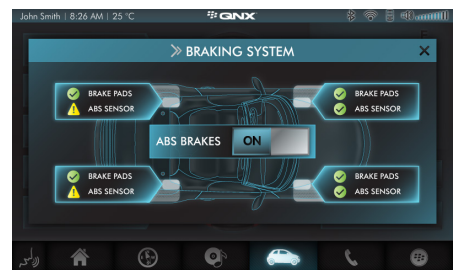
네이티브 인터페이스 기반이 되는 하드웨어와 시스템 서비스에 안전하고 통제된 방식으로 접근하기 위한 명확한 API