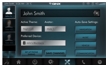
개인화 다운로드가 가능한 애플리케이션을 포함한 HTML5 HMI의 고유한 사용자 인터페이스 외장 변경