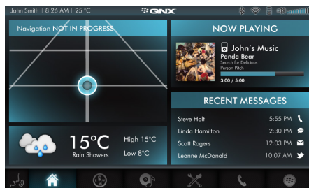
홈스크린 맞춤형 메인 스크린 제작을 위한 HTML5 기반 애플리케이션 위젯