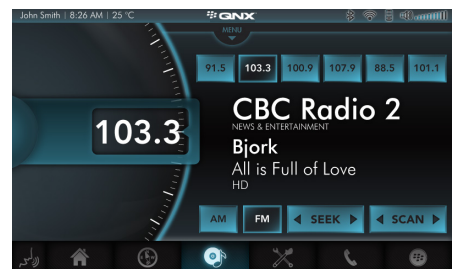
라디오 선택된 플랫폼에 보드에 탑재된 DSP 통합을 통해 RDS가 가능한 라디오 인터페이스