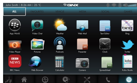
앱 스토어 애플리케이션 다운로드와 앱 스토어 기능 지원