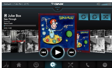
멀티미디어 iPods, iPhone DLNA 서버, USB 대량 저장 기기 및 인터넷 라디오 스트리밍을 위한 완전한 기능을 갖춘 미디어 플레이백 지원